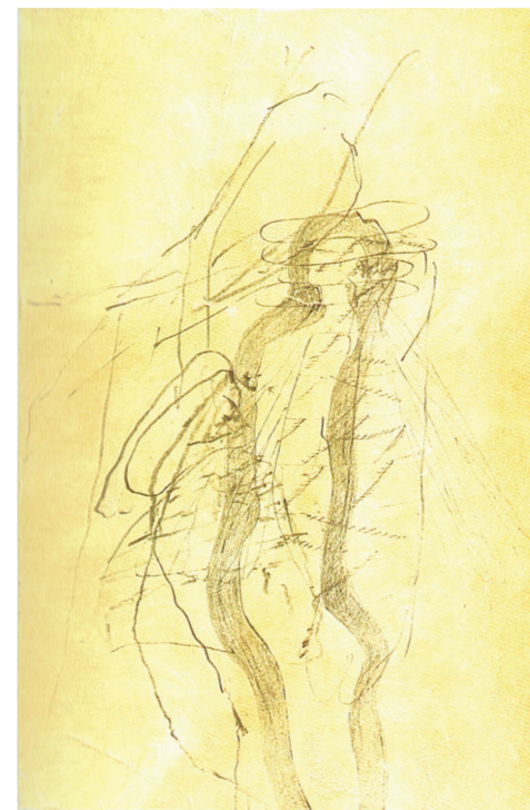
Blitz und Bienenkönigin, 1970, Aquatinta und Lithographie, 76 x 56,5 cm, Auflage 75

Unabhängig davon bauten Mitarbeiter der Pumpenfabrik Wangen in einer dreiwöchigen Arbeit für Beuys' Beitrag zur der documenta 6 in Kassel 1977 die Installation „Honigpumpe am Arbeitsplatz“.