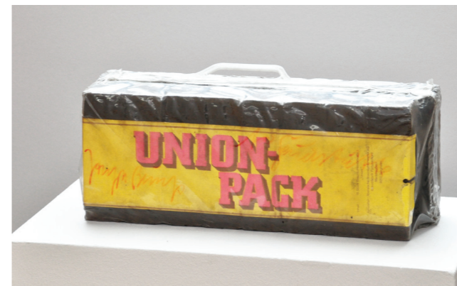
„für Feuerstätte“, 1978/1979, UNION-Pack Kohlebriketts in Klarsichtverpackung, 21 x 39 x 11, 3 Exemplare