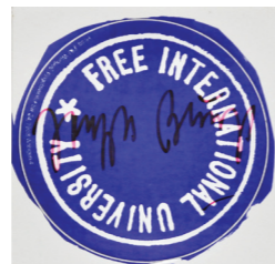
FIU-Aufkleber, signiert, 11 x 11cm,

Joseph Beuys (Krefeld 1921 - Düsseldorf 1986) war Künstler und Schamane, Redner und Leitfigur der Weltkunstszene in der Nachkriegszeit. Er war Vorläufer eines neuen Denkens und Handelns. Der Künstler erscheint uns immer wieder als ebenso originelle wie rätselhafte Persönlichkeit, die im Vertrauen auf die Sinnhaftigkeit des menschlichen Daseins neue Wege der künstlerischen Gestaltung ging und die Grenzen herkömmlichen Denkens sprengte.