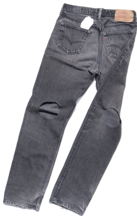
Die Orwell-Bein-Hose für das 21. Jahrhundert 1984, Jeanshose mit kreisrunden Öchern, ca. 90 x 45 cm, ca. 35 Unikate