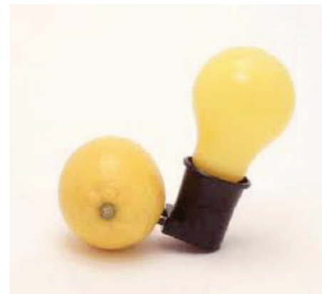
Capri-Batterie, 1985, Glühlampe mit Steckerfassung, Zitrone, Auflage 200