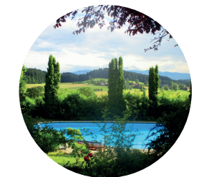
Blick vom Humboldt-Haus