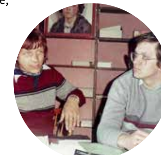
Hasenclever und Kretschmann im Humboldt-Haus, 1981

Ministerpräsident des Landes Baden-Württemberg