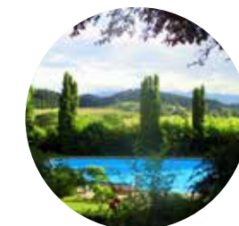
Blick vom Humboldt-Haus